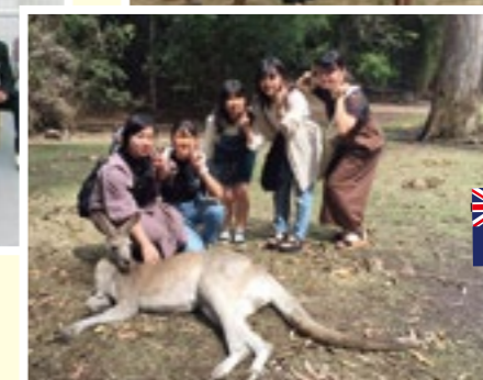
オーストラリアスタディーツアー(8月)