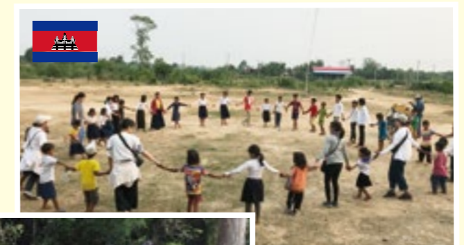
カンボジアスタディーツアー(12月)