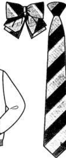
シルバークリボン